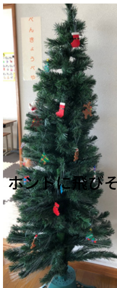
ホントに飛びそう

12月は新型コロナウイルス感染拡大抑制のためなかなか行事を実施できないなか児童たちはクリスマスツリー・作りに挑戦していました。