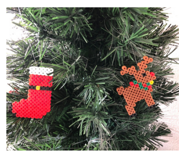
赤鼻トナカイと 赤いブーツ